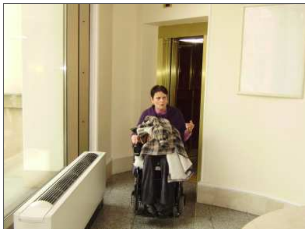
Výtah pomůže vozíčkářům, ale i těm návštěvníkům, kteří se chtějí vyhnout schodišti, dostat do všech pater.