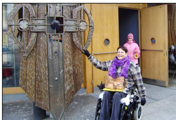
Divadla mohou být moderní atraktivní stavbou a současně zcela bezbariérová.