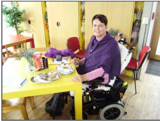
V této kavárně vozíčkáři zase vítají, že se mohou pohodlně zasunout ke stolu.